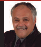
ROGER BUJEAU URBANISME