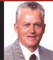
ROLAND SYLVAIN TRAVAUX PUBLICS