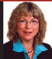
HÉLÈNE NOËL WATIER CULTURE, BIBLIOTHÈQUE