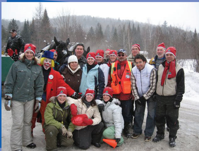
Quelques-uns des bénévoles entourant le maire